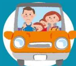
ドライブの渋滞時