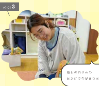
voice 3 私の門下の おかげです。

私がこの地で働くことを選んだのは、下町らしい人との距離感や、暮らしやすさを感じたからです。子どもたちと接する環境を整えてあげれば、それだけで満足感や達成感も出てくると思います。子どもたちと接する中で、自分自身も成長できると思います。子どもたちと接する中で、自分自身も成長できると思います。