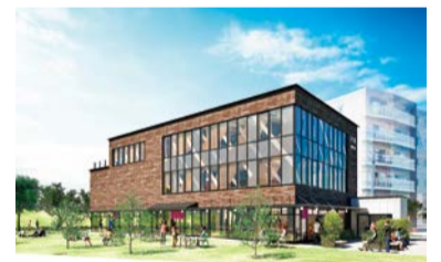
▲柴又川甚まちなみ館のイメージ

人口 473,464人 (男235,782人 女237,682人) 世帯数 258,789世帯 (令和8年4月1日現在)