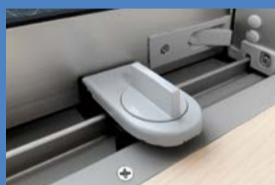
▲防犯性の高い錠・補助錠

令和6・7年度に申請した方も、新たに防犯設備を購入・設置する場合は申請できます(申請は年度内1回。複数品目申請可)。