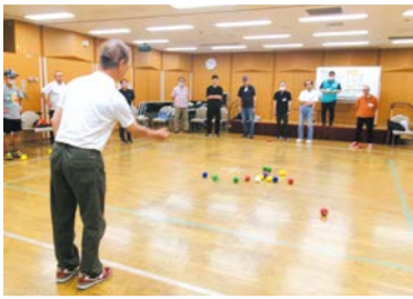
▲体を動かす簡単なゲームの様子

日 内 下表のとおり 会 シニア活動支援センター(立石6-38-11)、8月4日のみウィメンズパル(立石5-27-1) 区内在住 おおむね65歳以上の男性20人 費 600円 方 オンライン申請か往復ハガキ(「2面上欄記入事項」を記入)で、4月30日(必着)まで(多数抽選)。申 担 〒124-0012立石6-38-11シニア活動支援センター内地域包括ケア担当課 ☎03-5698-6202