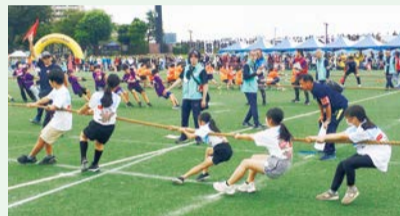
▲かつしかスポーツフェスティバルの様子