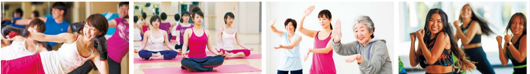
奥戸総合スポーツセンター体育館

大人クラス、子どもクラス、親子クラスなど全135クラス開催。3カ月ごとに申し込みができる教室です。