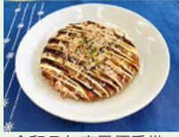
▲令和7年度最優秀賞「ふりかけお好み焼き風ホットケーキ」