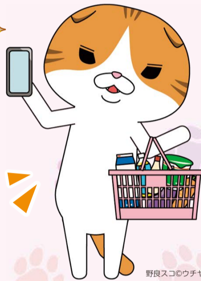
野良スコ©ウチャマユウジ