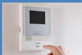
▲録画機能付きドアホン