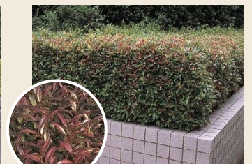
<秋の低木イメージ>