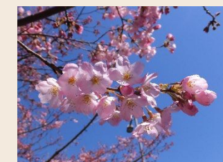
<春の花木イメージ>