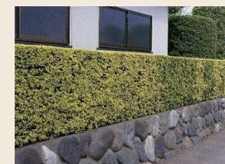
<常緑の低木イメージ>