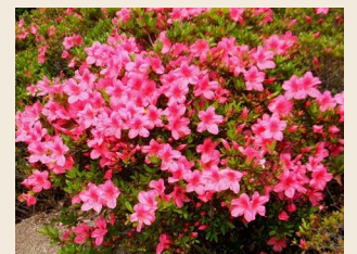
<春の低木イメージ>