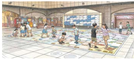
▲すごろくマップイメージ