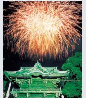
▲過去の花火大会の様子▶