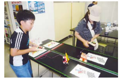
▲リモコンで動くロボットを作って遊ぼう