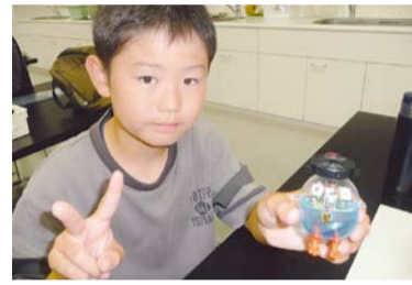
▲コンピュータボードを作ろう